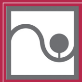
Bundesverband Garten-, Landschafts- und Sportplatzbau e.V.