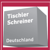
Tischler Schreiner Deutschland