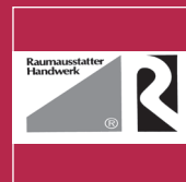
Zentralverband Raum und Ausstattung