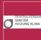
Zentralverband Sanitär Heizung Klima