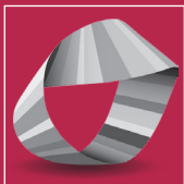
Bundesinnungsverband des Gebäudereiniger- Handwerks