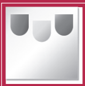
Bundesverband Farbe Gestaltung Bautenschutz